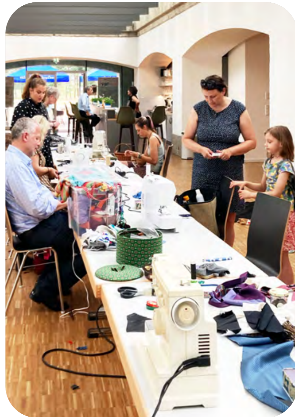
»Upcycling Kleidung« Workshop