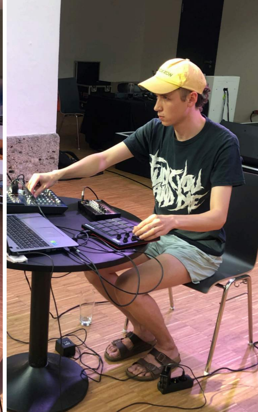
FUTURE SOUNDS brnjsmin | Giovanni Raabe