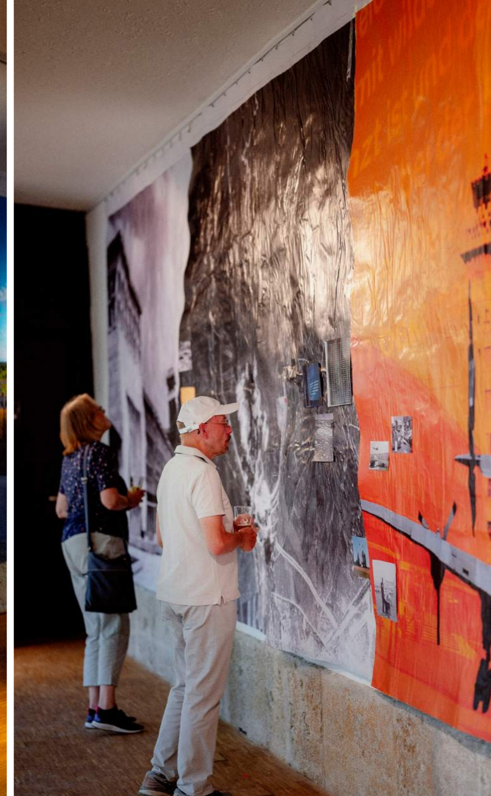
TIMELINE TAPETE Michael Lapper